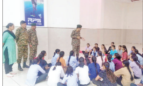
महेंद्रगढ़। विद्यार्थियों से बात करते एनसीसी अधिकारी।