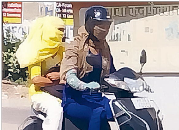
रेवाड़ी। वीरवार को लू से बचाव के साथ स्कूटी पर जाती युवतियां।

अप्रैल माह के अंत में गर्मी अपने प्रचंड रूप में आने लगी है। तापमान 42 डिग्री सेल्सियस के पार चले जाने के कारण वीरवार का दिन सीजन का सबसे गर्म दिन रहा। मौसम में 25 अप्रैल से बदलाव का अनुमान है। आसमान में बादल छाए और कुछ इलाकों में बूंदबांदी होने की संभावना जताई जा रही है। तीन-चार दिन तक मौसम इसी तरह का बना रह सकता है। वीरवार को