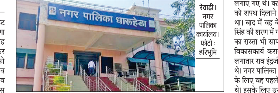
रेवाड़ी। नगर पालिका कार्यालय।