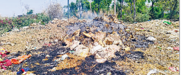
रेवाड़ी। धारुहेड़ा क्षेत्र में जलाया गया कचरा।

कूड़े के ढेर में आग से पूरे इलाके में छाया धुंए का गुब्बारा