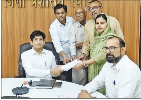
रेवाड़ी में चेयरपर्सन पद के लिए नामांकन दाखिल करते हुए प्रत्याशी।