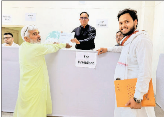
रेवाड़ी। धारूहेड़ा में चेयरमैन पद के लिए नामांकन दाखिल करते हुए प्रत्याशी तथा

वीरवार तक नगर परिषद रेवाड़ी के अलग-अलग वार्डों से पाषाण पदों के लिए 27 और नगर पालिका धारूहेड़ा में पाषाण पदों के लिए 16 प्रत्याशियों ने किया नामांकन दर्ज