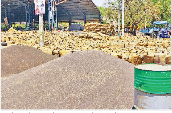
रेवाड़ी। रेवाड़ी अनाजमंडी में सड़क पर लगी सरसों की ढेरियां तथा गेहूं का उठान करते मजदूर।

■ रेवाड़ी मंडी में हैफेड ने 8 किसानों से 6200 रुपये एमएसपी पर खरीदी 121 क्विंटल सरसों